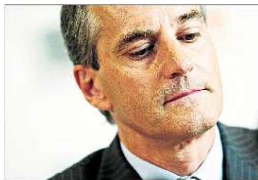
Utenriksminister Jonas Gahr Støre lar eventuelle inntekter fra sin kommende bok gå til et faglig ideelt formål.

«I den tykke boken som heter Norges Lover finnes ikke en eneste paragraf som kan gi ham den rett han har fått av Høyesterett»